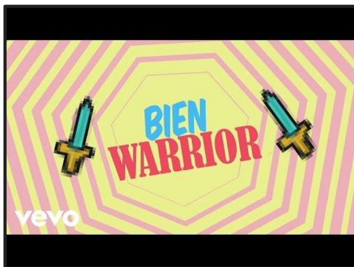
Bien Warrior. Miss Bolivia.

Aquí te proponemos escuchar dos canciones para reflexionar en relación a ciertas sensaciones que se ponen en juego al momento de elegir.