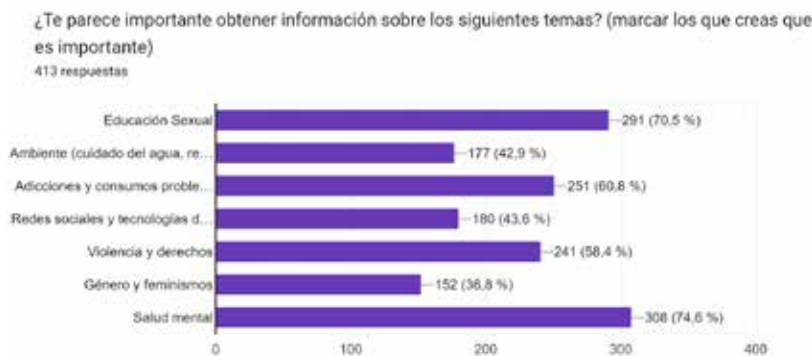
Gráfico nº 1: Temas sobre los que considera importante obtener más información

Los resultados provisionales corresponden a las escuelas: ENSAC, I.P.E.M nº 142 J. V. González y ProA de La Falda, I.P.E.T nº200 Huerta Grande e I.P.E.M nº 335 de Valle Hermoso. El total de estudiantes que participaron del relevamiento, a través de un cuestionario autoaplicado y asistidos por integrantes de EcF, es de 422. No incluimos en esta muestra los datos relevados de manera presencial en barrios populares.