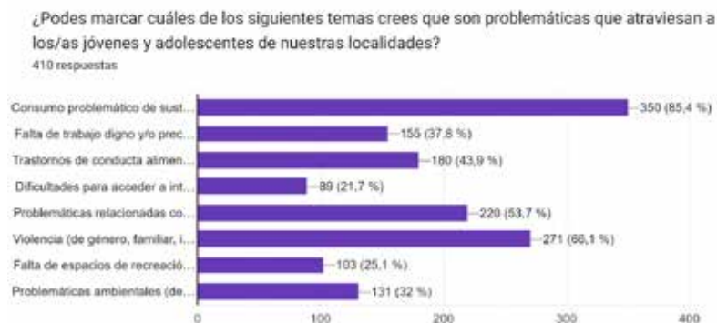
Gráfico n° 2: Problemáticas que atraviesan a jóvenes y adolescentes