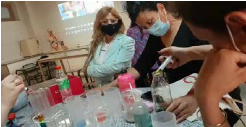
Figura 1: Registro fotográfico durante el desarrollo de un taller de experimentos. En primer plano se observan estudiantes del profesorado de nivel primario realizando actividades experimentales acompañadas por su profesora (San Rafael, Mendoza); mientras que, en el fondo de la imagen, se observa la proyección del encuentro virtual sincrónico con las científicas-docentes que guiaron el taller desde Córdoba.

Por otra parte, los talleres con niños y niñas de Córdoba-Argentina y Lima-Perú, también se realizaron de manera sincrónica utilizando las plataformas Zoom o Meet. Estos talleres realizados en 2020 y 2021 traspasaron las fronteras nacionales y permitieron una interacción dinámica y participativa entre docentes/profesorandos de Córdoba/Mendoza-Argentina y niños/as (6-11 años) de Lima-Perú, con fuerte acompañamiento por parte de sus padres/tutores. Los talleres de experimentos alcanzaron un total de 30 encuentros y se llevaron a cabo con participación voluntaria. En cada encuentro se presentó algún tema específico, utilizando un soporte multimedial, y un experimento remoto, alusivo a dicha temática, plausible de ser realizado por los niños/as. Los experimentos involucraban materiales de uso cotidiano y, en algunos casos, se utilizaron también laboratorios/simuladores virtuales. Se emplearon redes sociales para la difusión de los talleres y, previo a al primer taller, se creó un grupo de WhatsApp con los padres/tutores de los participantes a fin de contar con su consentimiento para el desarrollo de los talleres e