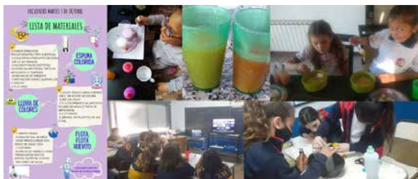
Figura 2: Talleres de experimentos con niños y niñas de Perú y Argentina. A la izquierda se muestra el diseño y contenido para la difusión de los materiales necesarios a utilizar durante un determinado taller. A la derecha, en la parte superior se muestran registros fotográficos obtenidos por padres/tutores de niñas realizando experimentos, mientras que las imágenes de la parte inferior corresponden al registro fotográfico realizado por una de las docentes del 6° grado de una escuela del interior de la Provincia de Córdoba, quien se conectó con sus estudiantes para participar del taller.

En la Figura 2 se muestra una recopilación de imágenes en donde se observa el diseño y contenido de la lista de materiales para un determinado taller y a los niños y niñas en sus hogares y escuela realizando uno de los talleres.